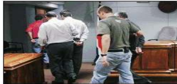
Los sentenciados fueron enviados a prisión para evitar cualquier intento de fuga, según el Tribunal. Jorge Arce

Una notaria pública, un corredor de bienes raíces y un particular, fueron condenados ayer por participar en un fraude millonario con propiedades.